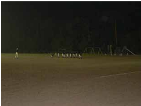
レギュラーも守備と走塁の対戦練習