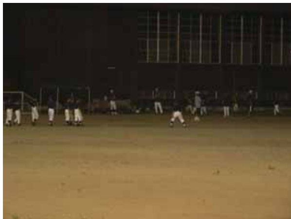
対戦前の作戦会議