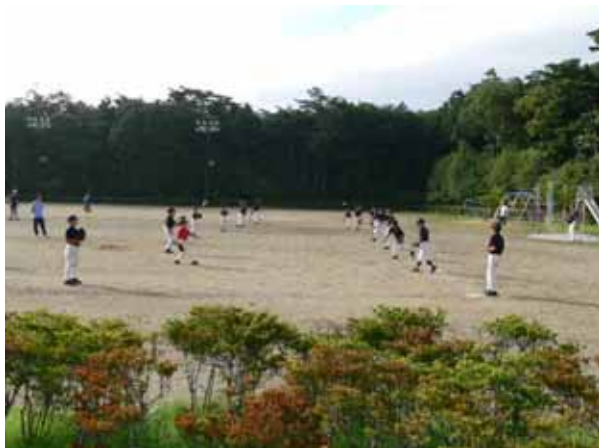
6:00 精進小グラウンドで朝飯前の早朝練習