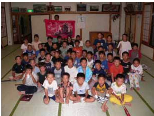
みんな上がったかな？ 楽しんだ後の記念撮影