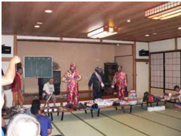
21:00 テーマ音楽なしでピンゴマン登場