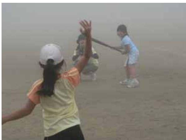
その頃、母娘たちはソフトボールの練習