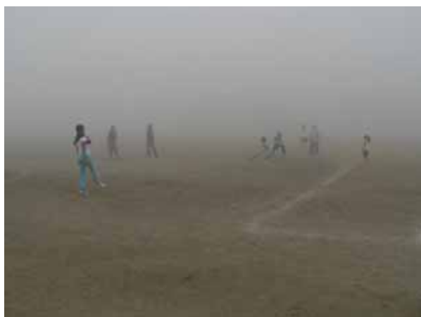
雲が切れず危ないので、残念ながら八八対ジュニアのソフトボール対決は中止になりました。