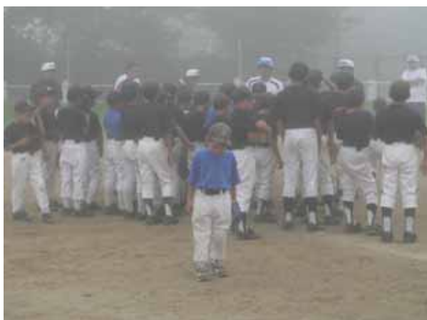
1年生にはチョット難しかったかな？