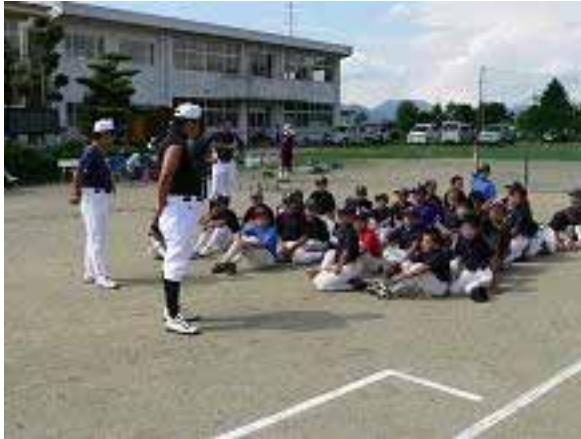
3フットラインって何？ YMD コーチの勉強会