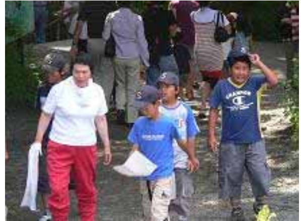
子供達は帰りも元気です。