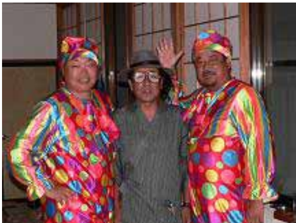
ピンゴマンは準備完了