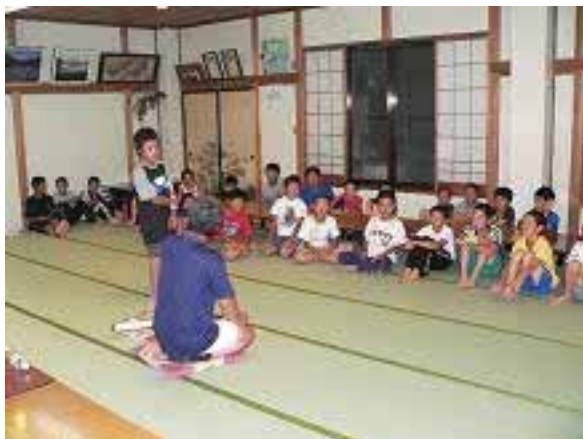
窓ガラスは「かがみ」になるよ。