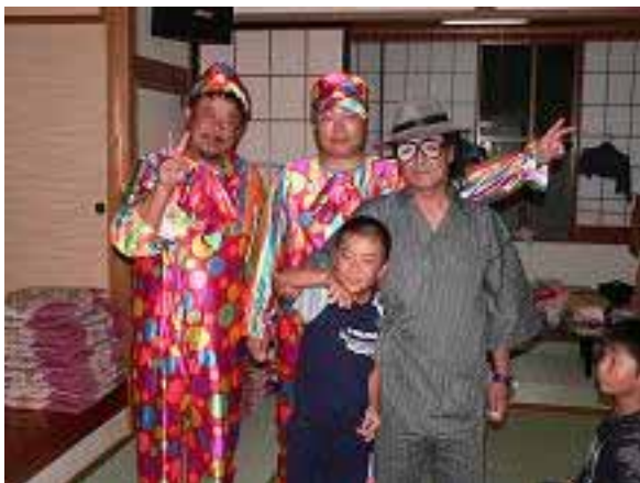
ビンゴ第一号はSSK君