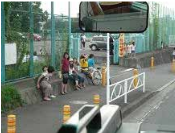
代表挨拶 只今無事帰りました。