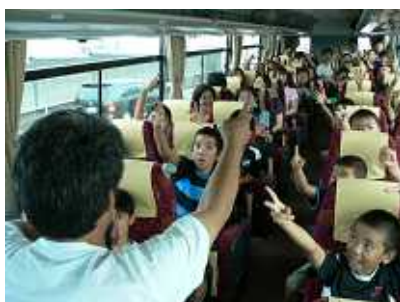
バスの中ではジャンケン大会