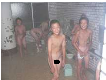
子ども達はお風呂の時間