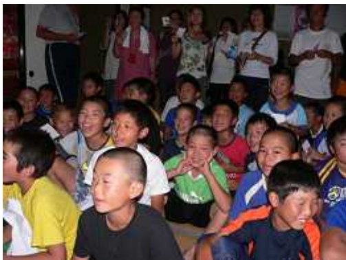
さあお待ちかね。ビンゴ大会の始まりだ。 みんなで「ビンゴマ〜ン！」