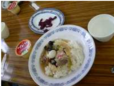
到着日のお昼ごはん チョット寂しいので、福神漬けも写してみました。