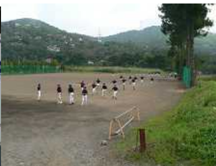
練習場はサッカーグラウンドでした