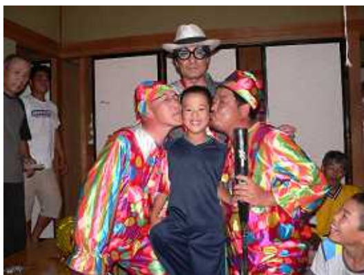
トップビンゴはユウト。