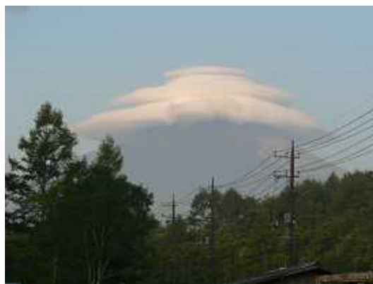
きれいな富士山を見なかったのかな