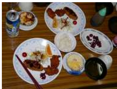
初日の夕食は、 コロッケと唐揚げ