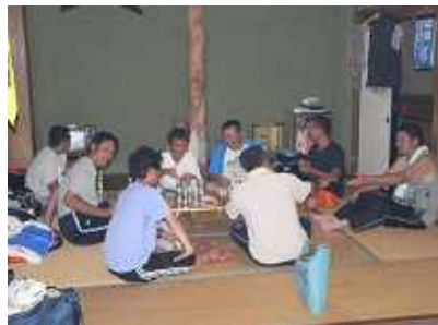
おとな達は、夕食前のお楽しみ ジュニアコーチ