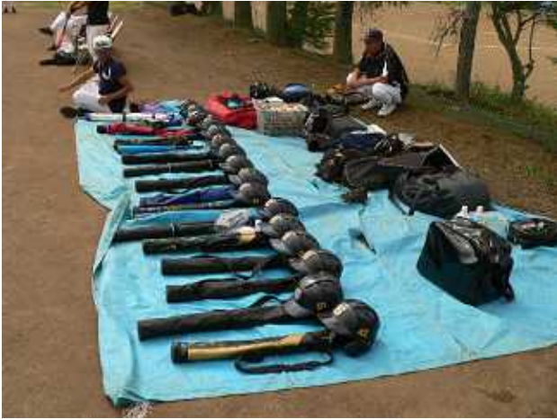
ジュニア選手の荷物。 レギュラーのはお見せできません。