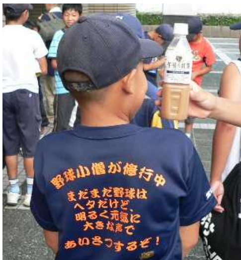
修行中の野球小僧