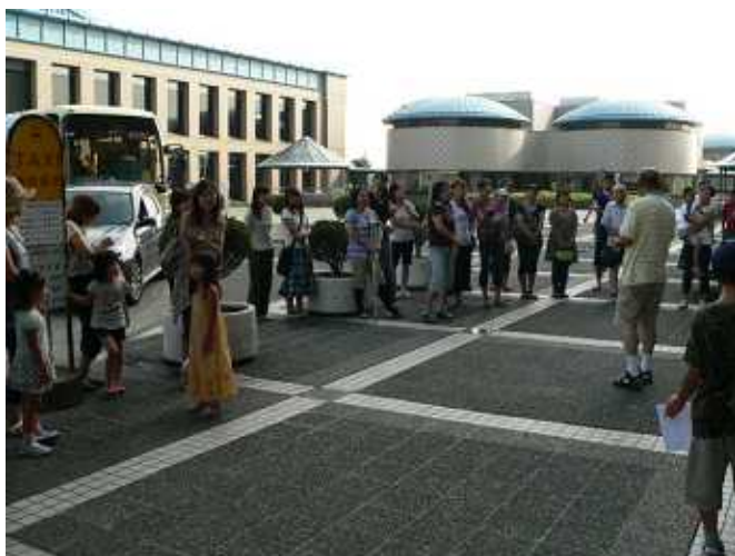
おかあさん達が心配顔でお見送り。 お迎えのときのびっくり顔がたのしみです。