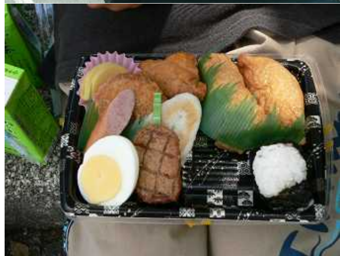
誰ですか？ 「これじゃあ足りない」なんて言っているのは。