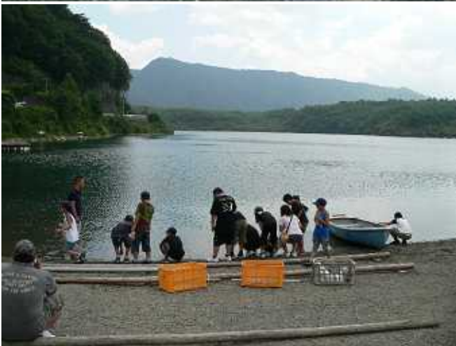
湖で泳いだのは一人だけでした。 野球でもこのくらい良い顔でプレイできたらいいのに。