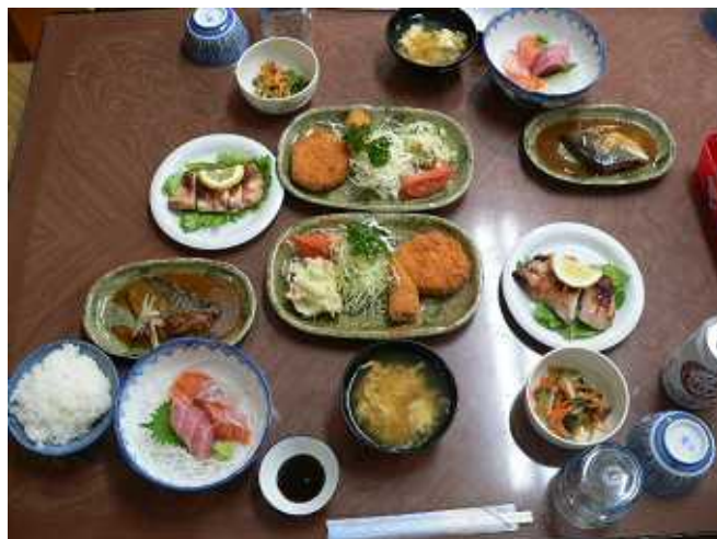
今日の夕食はすごい、焼き物、揚げ物、煮物、刺身・・・ 全部がメインディッシュ！！ 食べきれののかなあ。