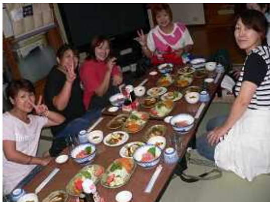
今日はユウマ母の誕生日。 はっぴばーすでーつーゆー (日本人ですから)