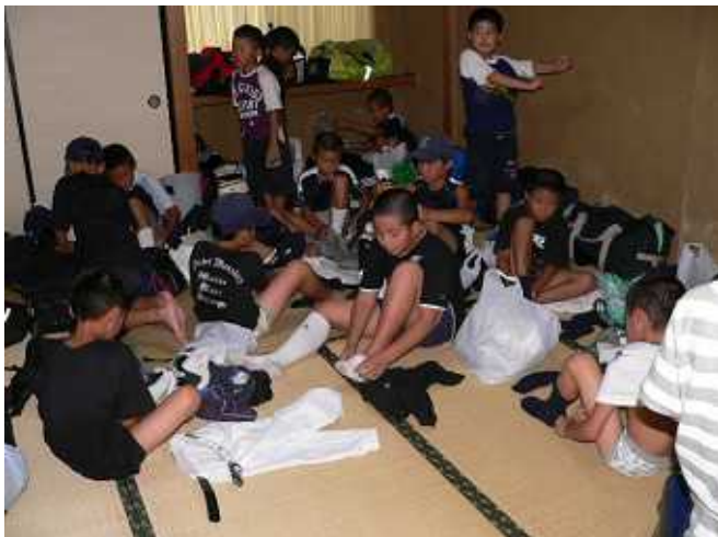
合宿最初の練習に向けて子供たちは準備中