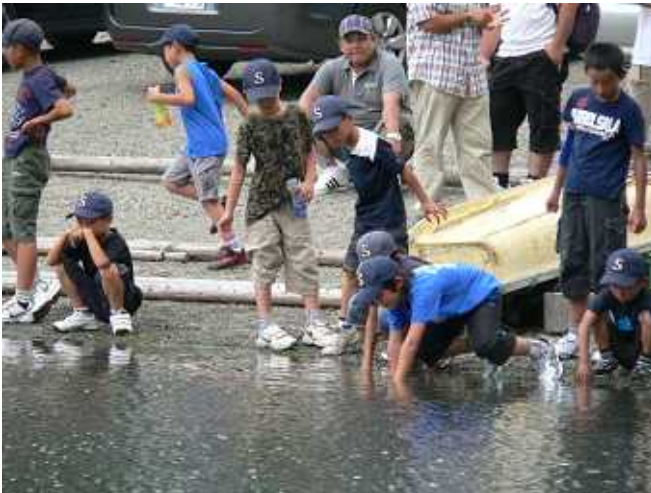
西湖湖畔で時間調整。