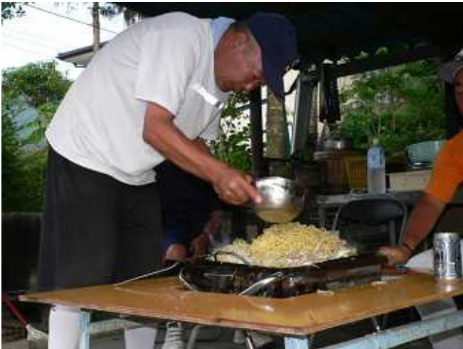
子供たちのために、しっかり味見しないとネ。